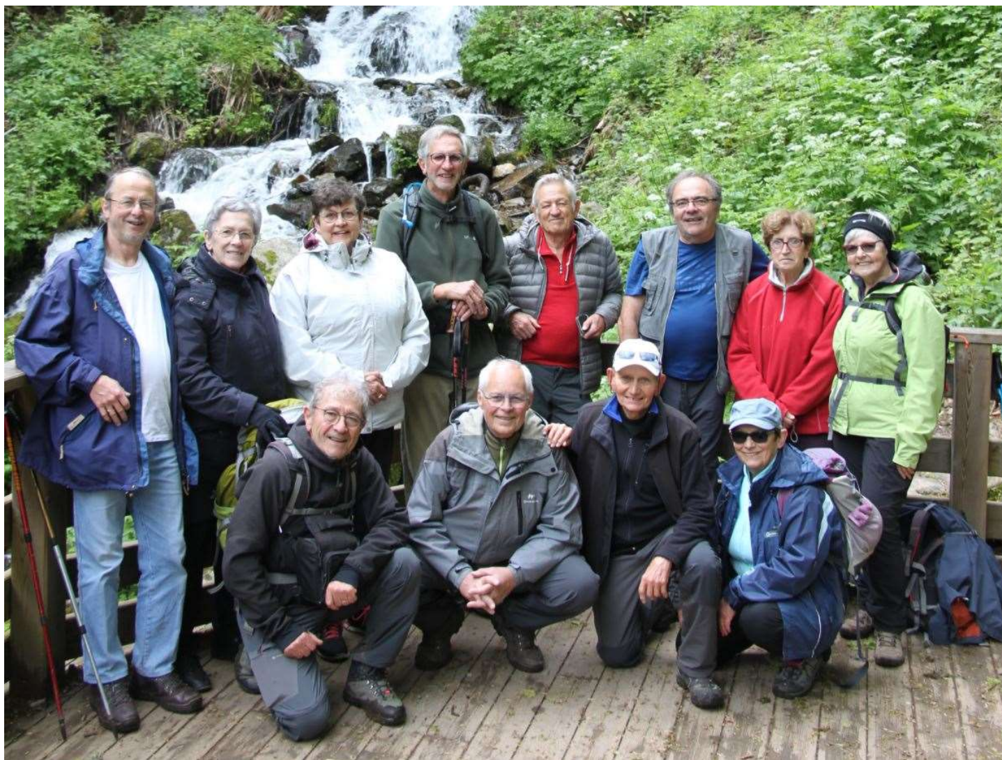
Photo prise à la cascade du Hohwald près du Mont Sainte-Odile

Les randonneurs ont été plus heureux car ils ont pu effectuer 14 sorties dans les Vosges. Il y avait entre 4 et 12 participants. La sortie à Mariastein (35 km) n'a pas pu avoir lieu faute de participants.