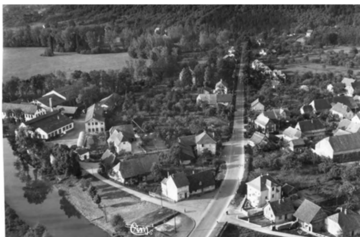
1950 – Vue route de Mulhouse