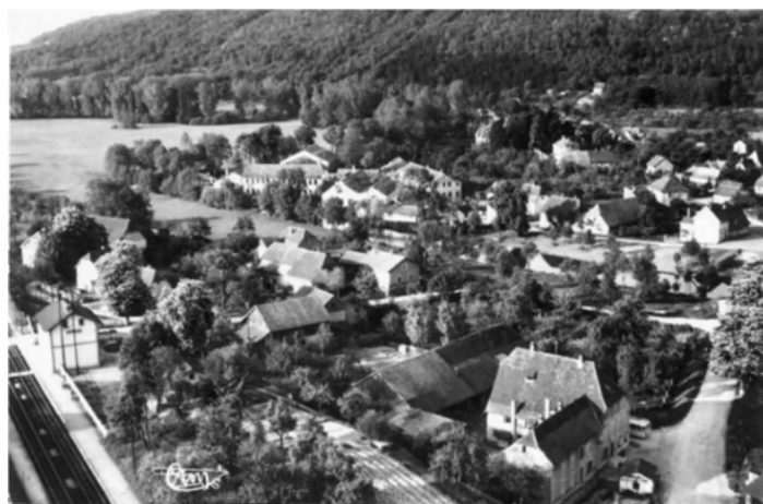
1950 – Vue derrière la gare