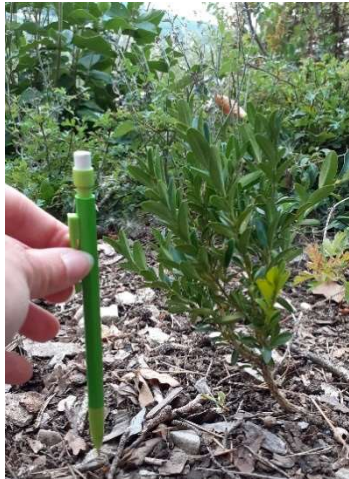
Jeune Buis de quelques centimètres.

Actuellement, la réserve compte environ 70 Buis adultes qui constituent des semenciers situés principalement en lisières et au niveau de la pelouse.