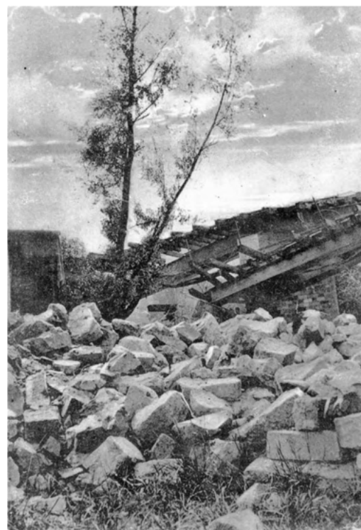
Pont de chemin de Fer (direction Illfurth) détruit le 02/08/1914 vers minuit.

Si vous possédez vous-même des photos retraçant l'évolution et l'histoire de Tagolsheim, merci de les transmettre en mairie par mail à mairie@tagolsheim.fr ou nous les déposer en mairie afin que nous puissions les copier. Nous vous remercions pour votre collaboration à la collecte de mémoire de notre village.