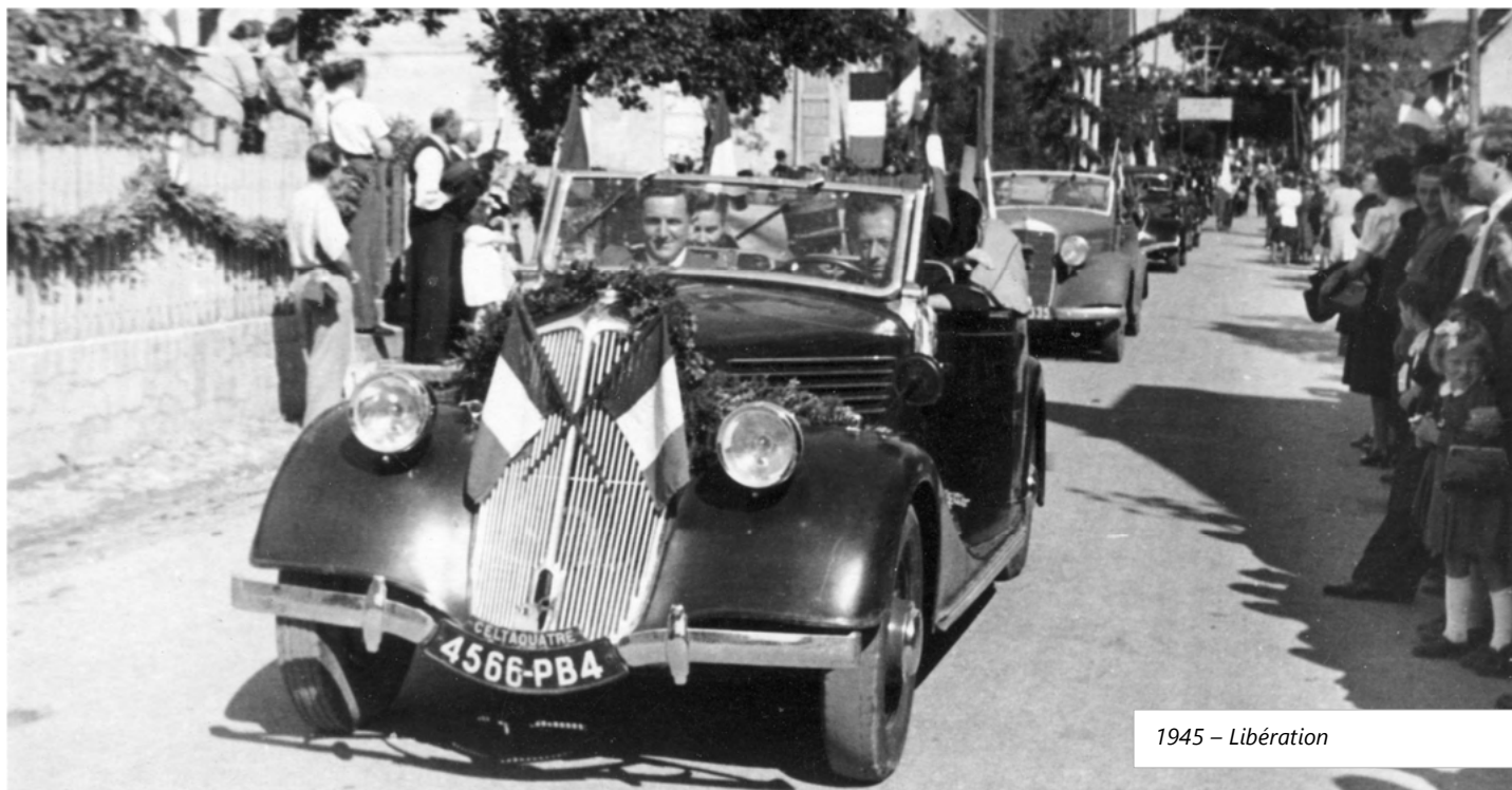
1945 – Libération