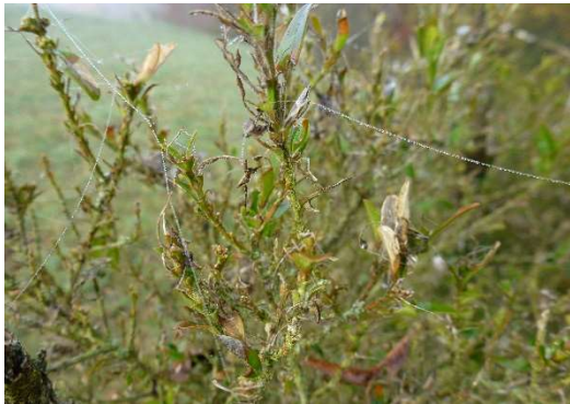
Feuilles de Buis grignotées par la Pyrale

Sur l'ensemble des Buis de la réserve naturelle, douze ont été marqués et font l'objet d'un suivi précis de leur état sanitaire et de leur croissance.