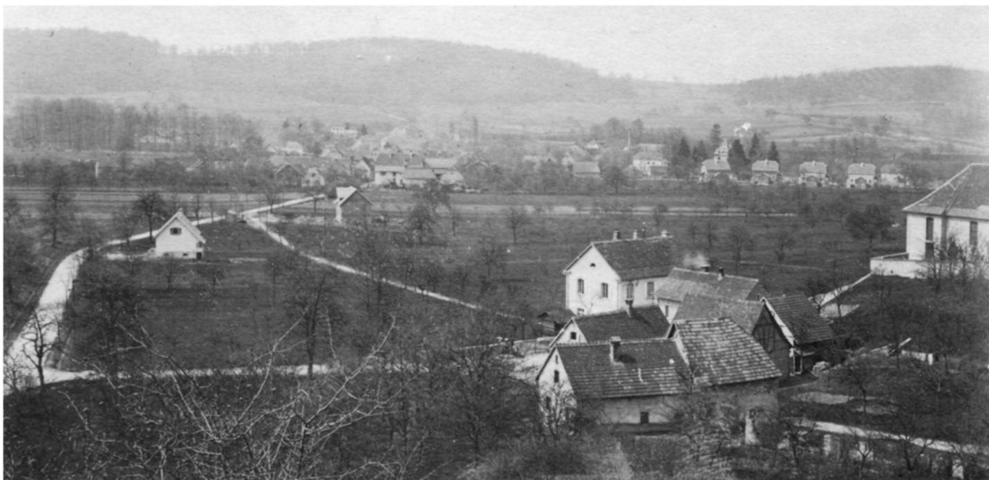
1928 – Vue depuis le Semberg