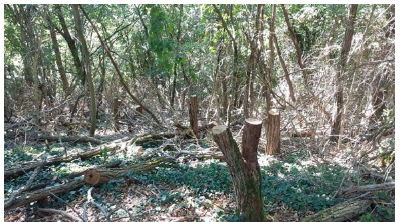
Trouée de lumière réalisée par coupe de Robiniers

Les arbres ont été coupés à un mètre du sol dans le but de conserver des tiges-sève afin d'éviter des rejets trop importants qui sont toutefois régulièrement coupés.