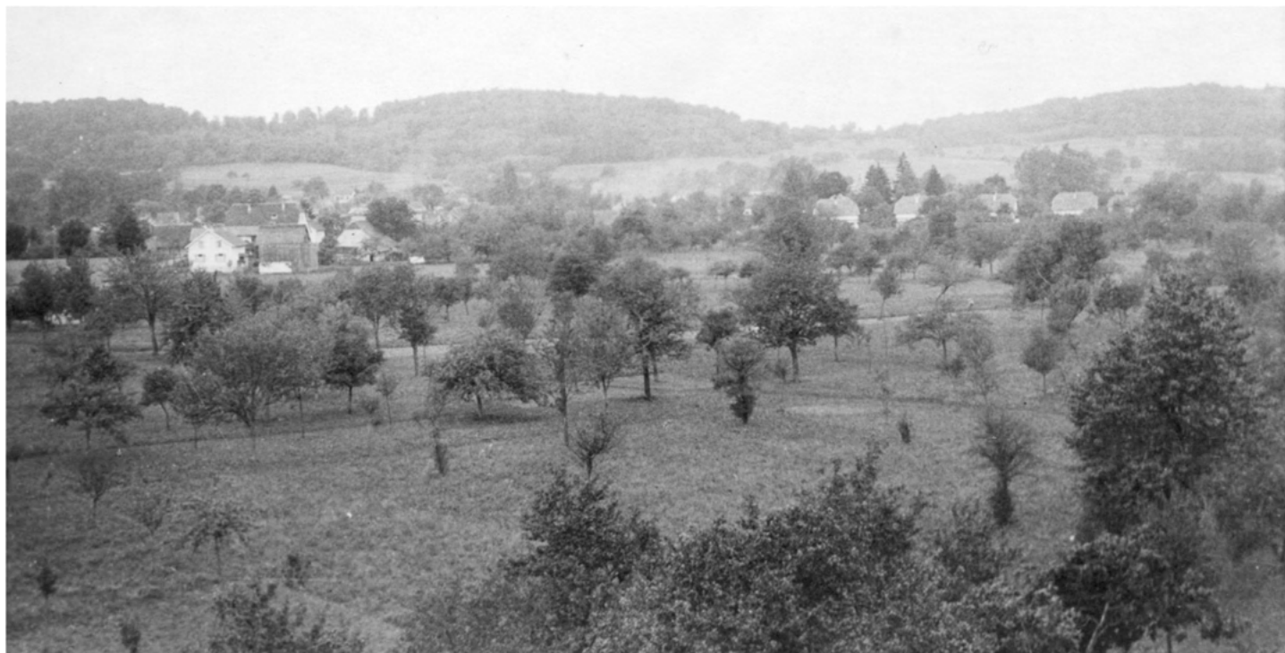
1931 – Prés de Rollingen

Si vous possédez vous-même des photos retraçant l'évolution et l'histoire de Tagolsheim, merci de les transmettre en mairie par mail à mairie@tagolsheim.fr ou nous les déposer en mairie afin que nous puissions les copier. Nous vous remercions pour votre collaboration à la collecte de mémoire de notre village.