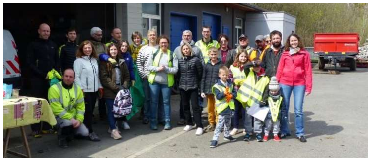
24 sacs de déchets dont 8 de déchets plastiques ainsi que 80 bouteilles de verre.

Après l'effort, le réconfort ! Les bénévoles se sont retrouvés autour d'un café et ont pu déguster quelques parts de tartes. Merci à tous ceux qui ont participé !